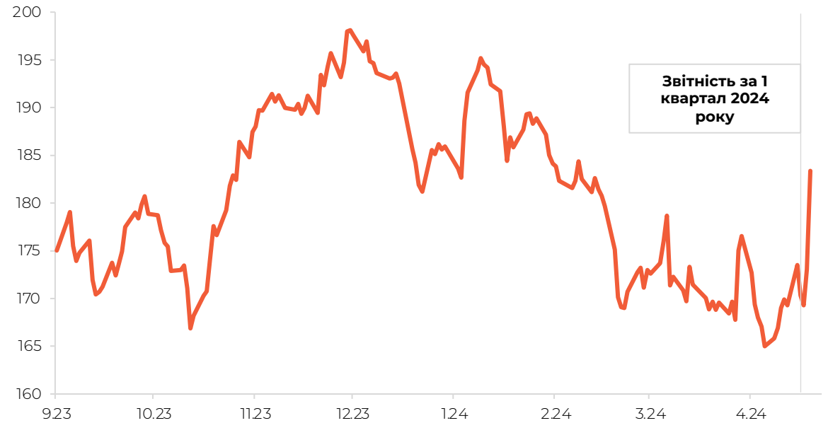
Динаміка ціни акцій Apple