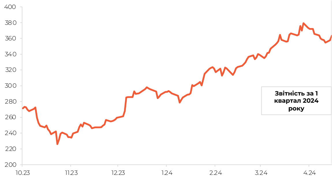
Динаміка ціни акцій Caterpillar

Загалом тиждень пройшов більш позитивно для більшості компаній. Проте, на нашу думку, найбільш цікавими для фіксації теперішнього стану ринку та економіки є звіти Meta та Caterpillar, реакції на звіти яких були негативними.